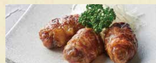
● 鶏レバの網脂包み焼き(3個)