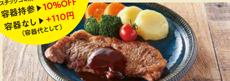
● 牛肉のサーロインステーキ