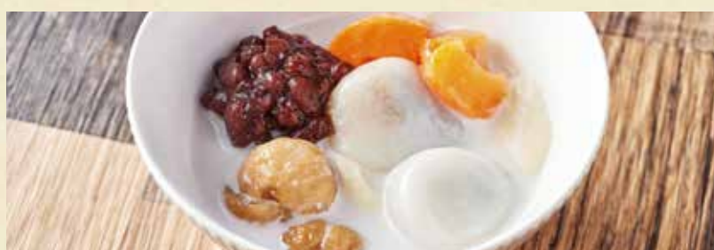
141特製ココナッツミルク