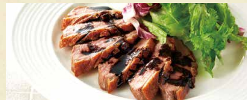
● 鴨肉のバルサミコソース