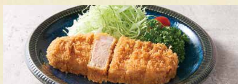
● 上州豚の低温熟成とんかつ