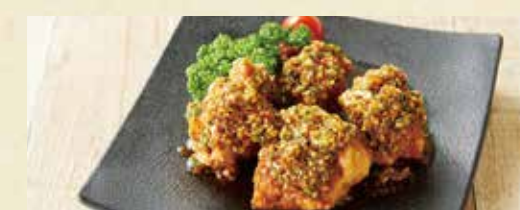
● 薬味たっぷり油淋鶏