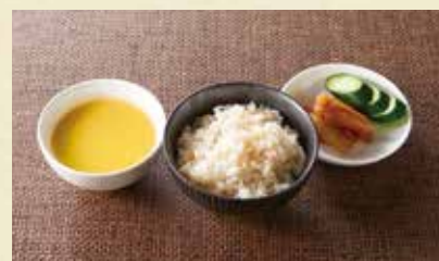
A SET 発芽玄米ご飯・漬物・スープ