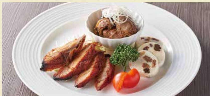
オードブル3種盛合せ

※内容・アレルギー成分はスタッフまでお尋ねください。 ¥770 (本体価格¥700)