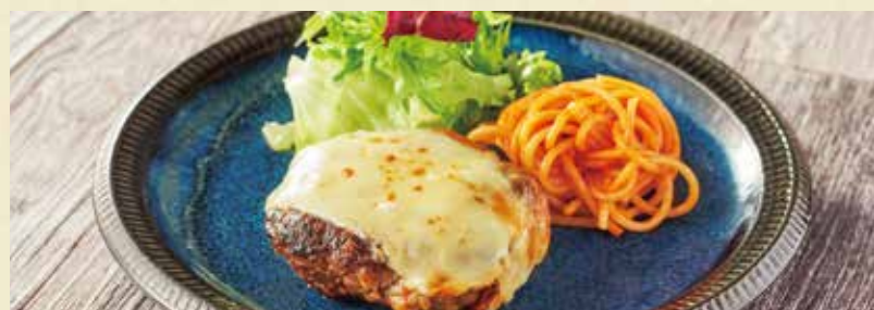
● 国産肉の手作りチーズハンバーグ