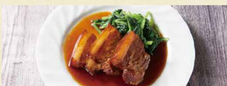
● 東坡肉(皮付豚肉の柔らか煮)