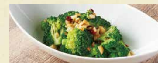
● ブロッコリーのアーリオ・オーリオ風