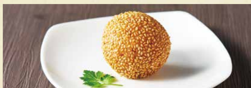
胡麻付き揚げ菓子