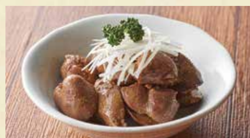
冷製カレーレバー