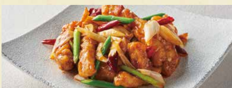
● カジキと野菜の辛子甘酢炒め