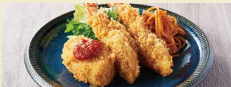
● 海老フライ&海老クリームコロッケ