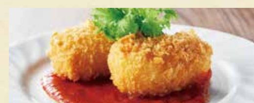
● 海老クリームコロッケ(2個)