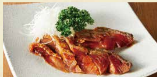
● 鮭の中国風薫製(冷製)