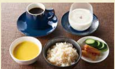
C SET 発芽玄米ご飯・漬物・スープ・デザート・コーヒー又はソフトドリンク