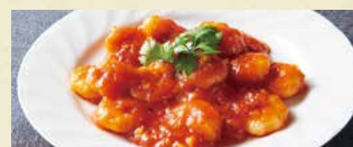
● 海老のチリソース煮