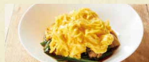
● ニラと塩豚の炒め 玉子包み