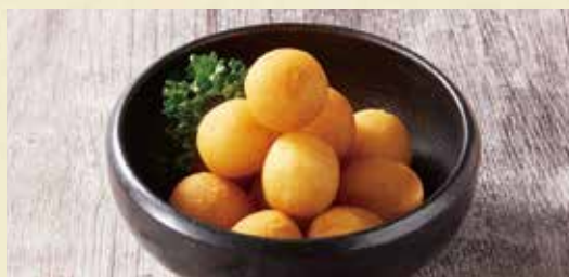
● ポテトチーズボール