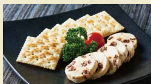
レーズンクリームチーズ