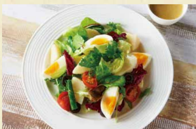
141オリジナルサラダ