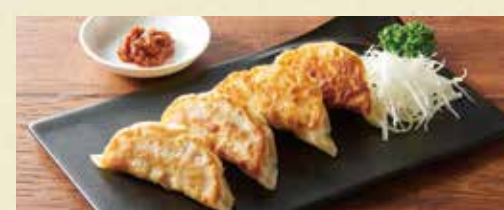
● 餃子2種盛り合わせ(肉・海老チーズ)