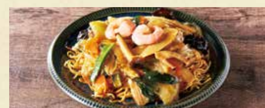
● 五目あんかけ焼きそば