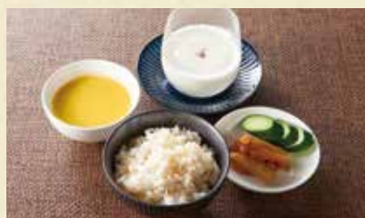
B SET 発芽玄米ご飯・漬物・スープ・デザート