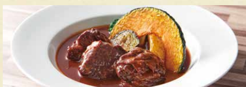
● 牛肉の特製赤ワインソース煮