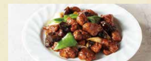
● 鶏レバーの麻辣炒め