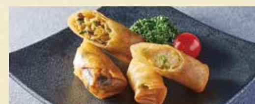
● 春巻2種盛り合わせ(カレー・海老アボカド)