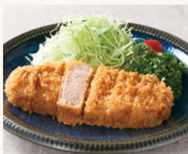
上州豚の低温熟成とんかつ (発芽玄米ご飯・漬物・スープ付)