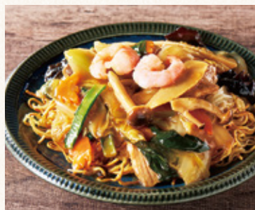
五目あんかけ焼きそば (漬物・スープ付)