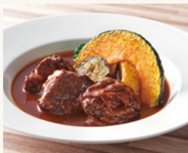
牛肉の特製赤ワインソース煮 (発芽玄米ご飯・漬物・スープ付)