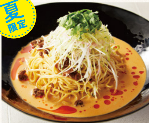
冷やし担々麺 (漬物付)