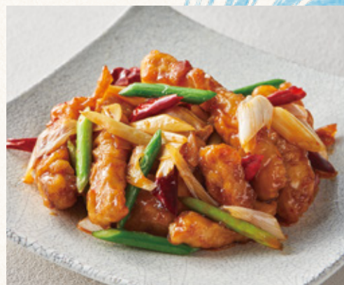
カジキと野菜の辛子甘酢炒め (発芽玄米ご飯・漬物・スープ付)