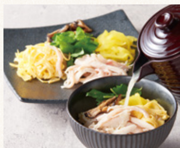
141特製 白湯掛け鶏飯 (デザート付)