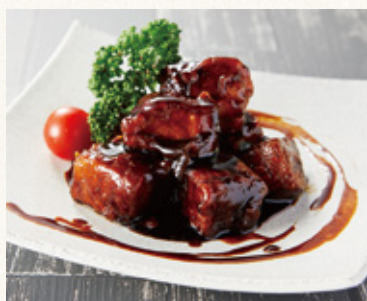
141特製黒酢スプタ (発芽玄米ご飯・漬物・スープ付)