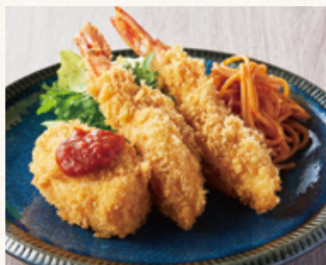
海老フライ&海老クリームコロッケ (発芽玄米ご飯・漬物・スープ付)