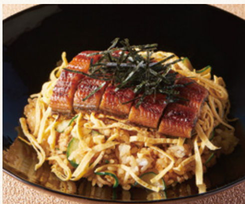
鰻のちらしご飯 (漬物・スープ付)