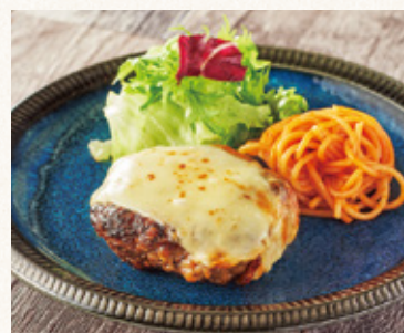
国産肉の手作りチーズハンバーグ (発芽玄米ご飯・漬物・スープ付)